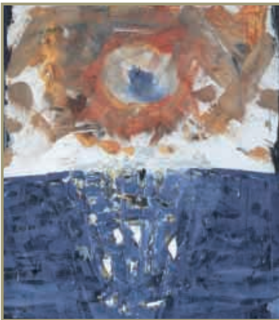
Georgios Maroulis, "Thalassographia", 1997